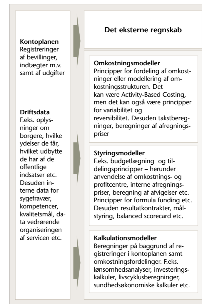
FIGUR 2. ØKONOMISTYRINGENS MODELLER.

balanced scorecard og principper for udarbejdelse af resultatkontrakter (se f.eks. Merchant & van der Stede 2017; Simons 2000).